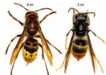
Frelon européen 4cm Frelon asiatique 3cm

Au printemps, il est important de rechercher les nids primaires, se trouvant la plupart du temps à max. 2 mètres du sol. En cas de découverte d'un nid (ou de suspicion), il est possible d'annoncer vos observations sur le site www.frelonasiatique.ch , qui regorge également d'informations complètes sur le sujet. N'hésitez pas à vous informer et en cas de besoin, contactez la Municipalité ou la Fédération vaudoise des sociétés d'apiculture. www.apiculture.ch